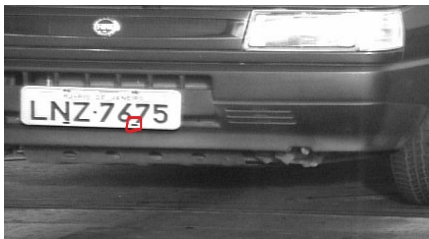
FIGURA 1: imagem original do banco de imagens.

A Figura 1 mostra uma das imagens originais do banco de imagens com uma marcação indicando o ponto onde se localiza um dos buracos característicos da placa.